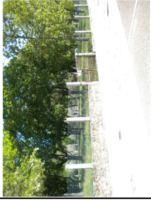
APO1 VIA DELLE TERME - BAGNO VIGNONI